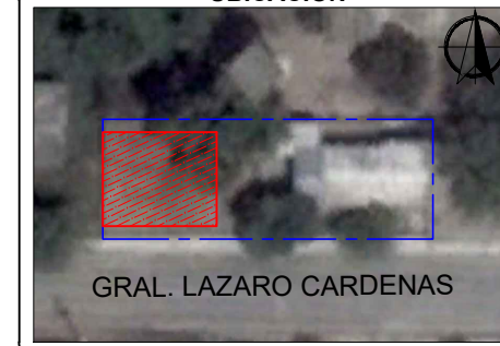
GRAL. LAZARO CARDENAS