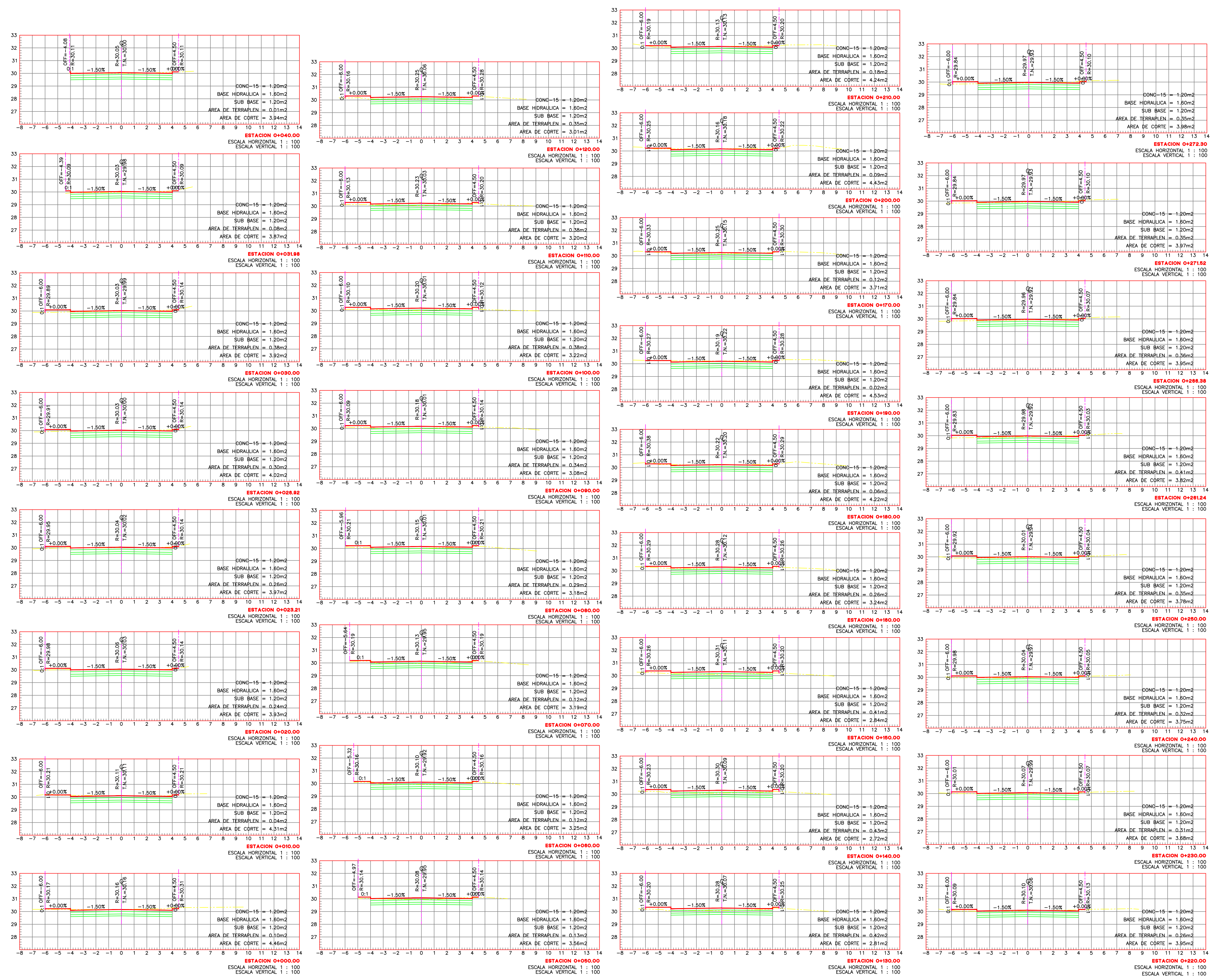
SECCIONES DE PROYECTO ESC. S/N