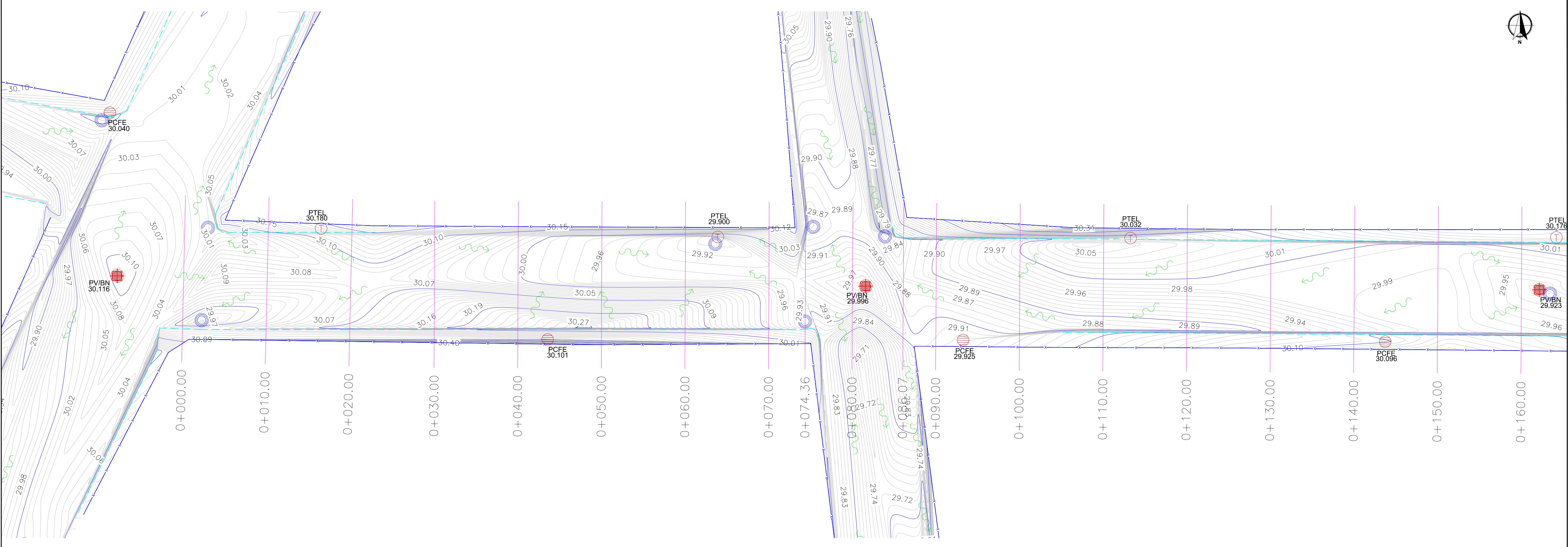
PLANTA TOPOGRAFICA ESC: S/E