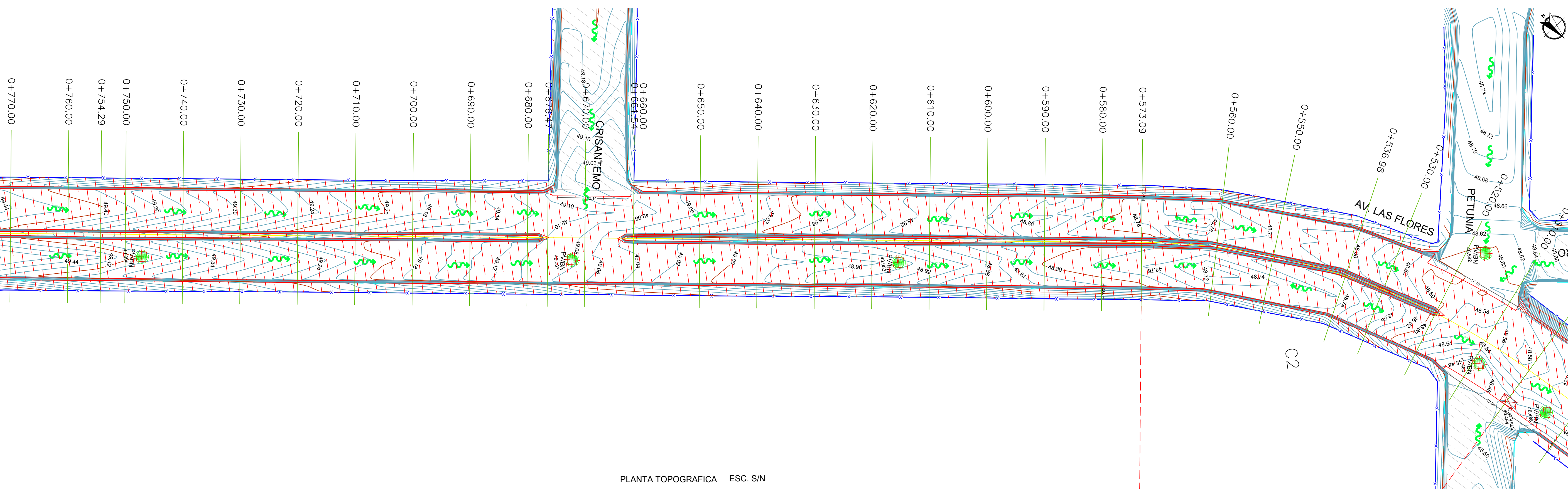
PLANTA TOPOGRAFICA ESC. S/N