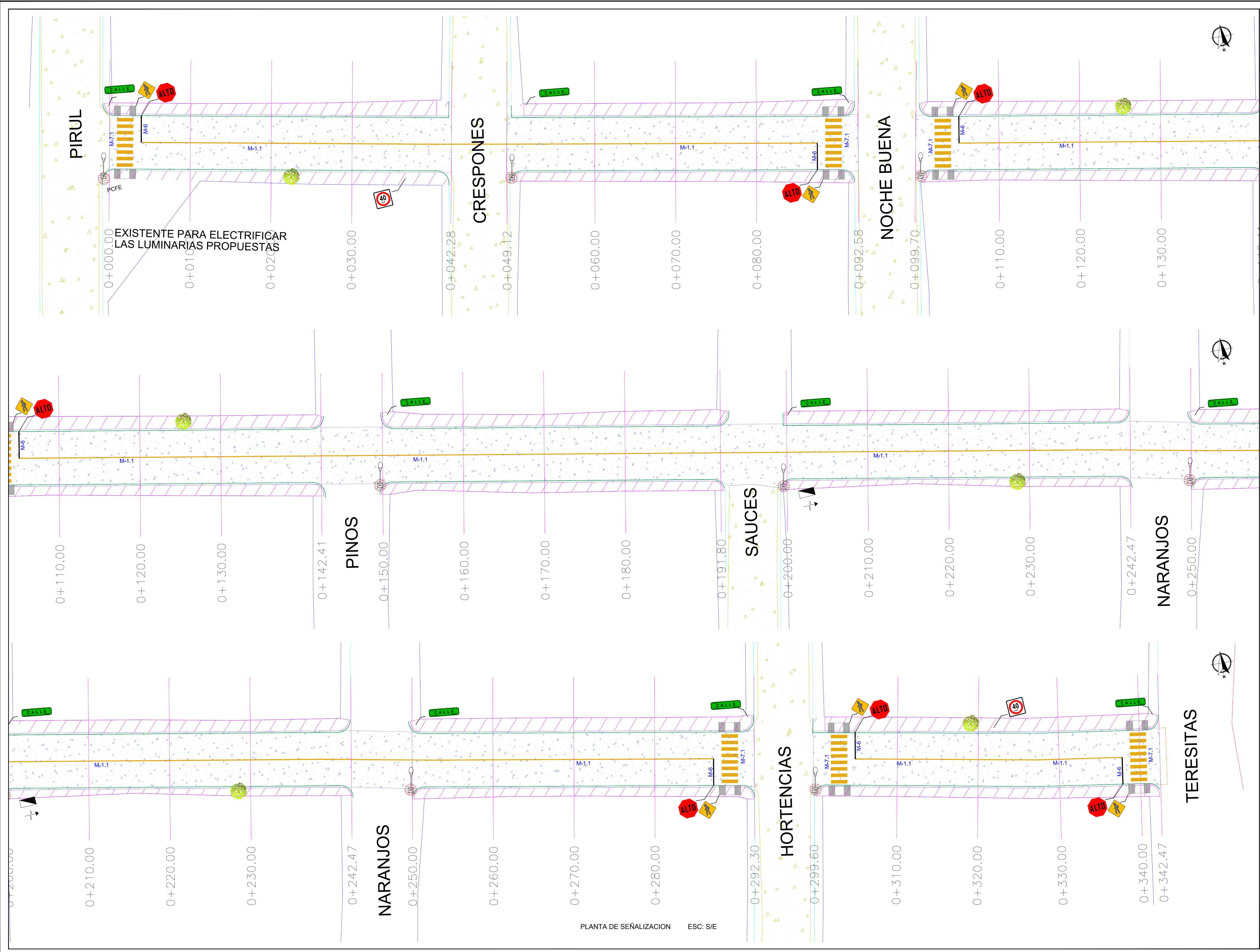
PLANTA DE SEÑALIZACION ESC: S/E