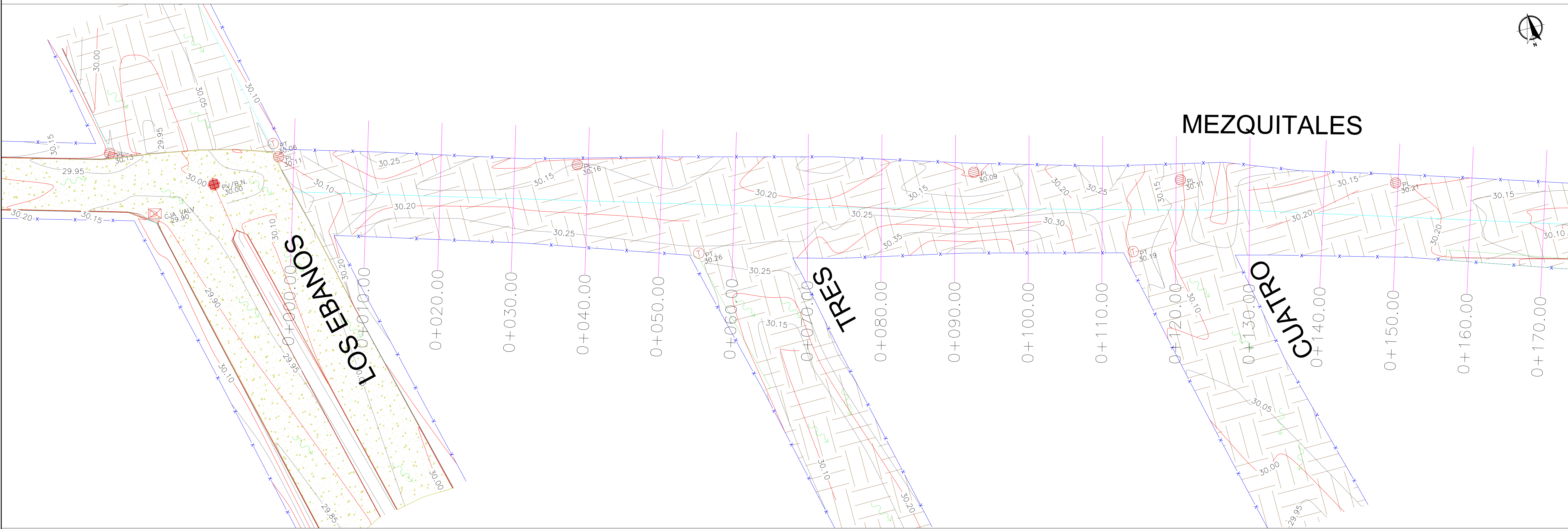
PLANTA GEOMETRICA ESC: S/E