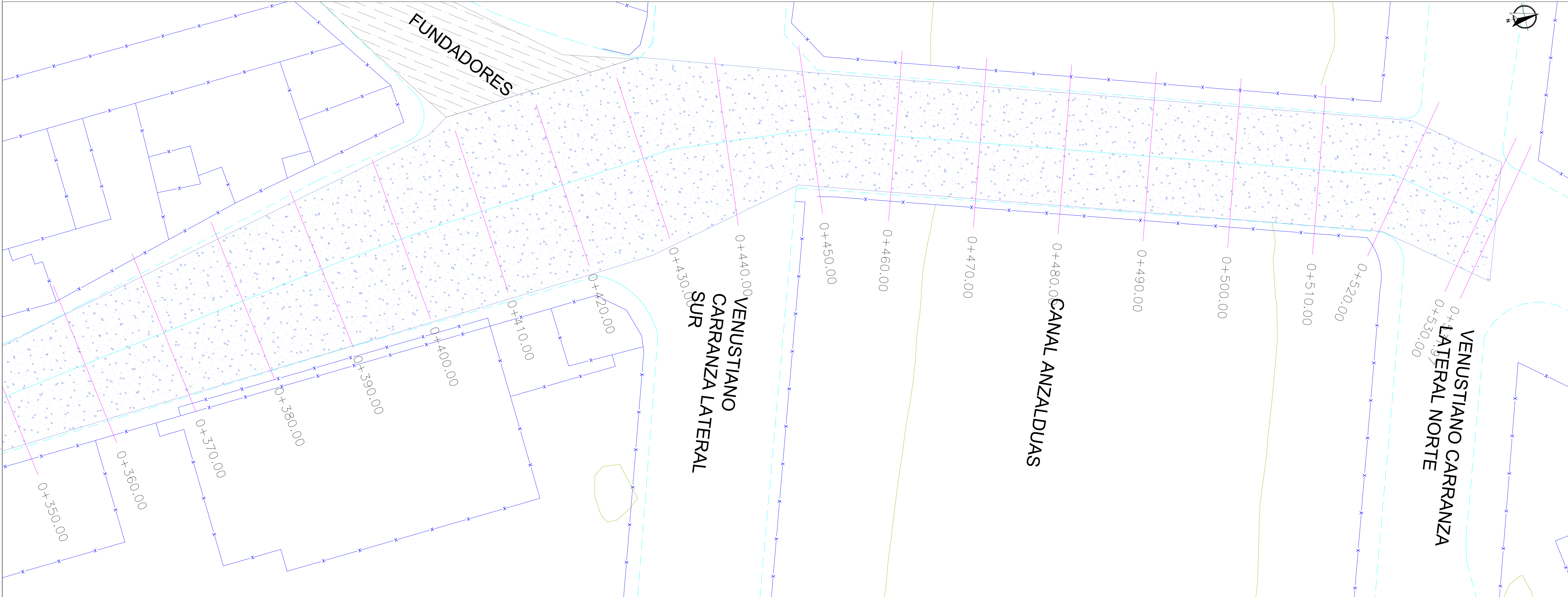
PLANTA GEOMETRICA ESC. S/N